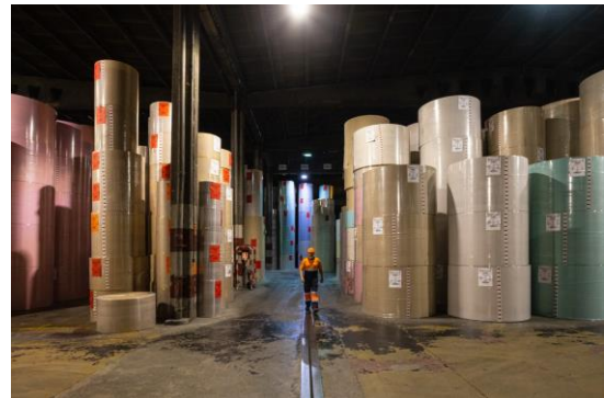
Alier produce carta riciclata al 100% per diversi utilizzi finali.